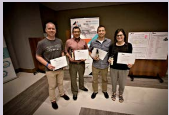
HET GEMEENTESTICHTINGSTEAM UIT ALCORA