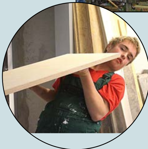
MENSEN UIT DE WIJK ZETTEN ZICH VOL OVERGAVE IN

Gemeentestichten begint met discipelschap, niet met een kerkdienst.