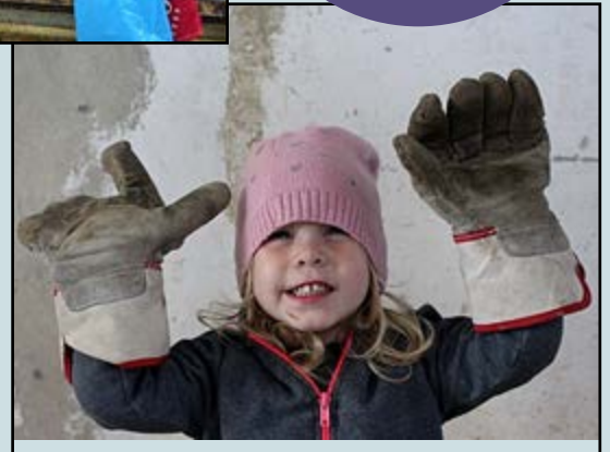
IN HET PATCHWORK CENTER KAN IEDEREEN MEEDOEN, GROOT EN KLEIN