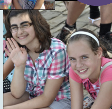
KINDERWERK IN BULGARIJE