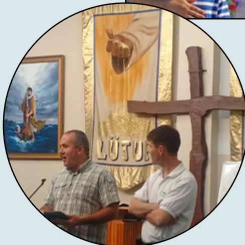
TOERUSTING IN ISTANBUL

Bid voor Europa. Bid voor een opwekking. Bid dat God een wonder verricht.