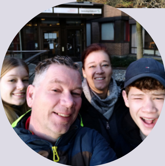
DE FAMILIE POELARENDS IN ZWEDEN