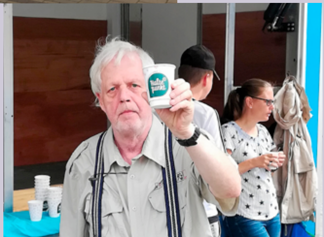
EEN STAMGAST VAN HET STRAATCAFÉ