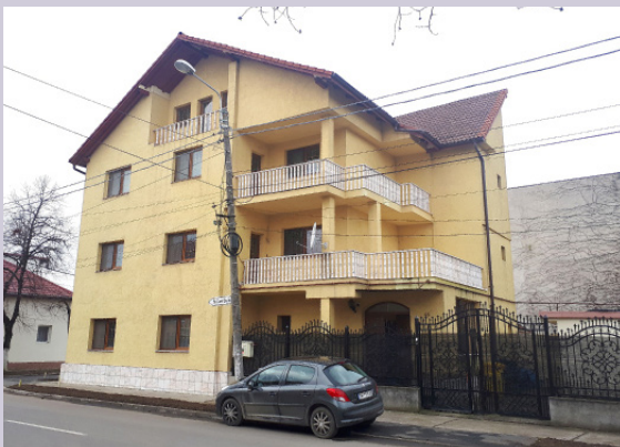
CASA MITSPA KAN HOPELIJK IN APRIL GEOPEND WORDEN

Alexia organiseert veel acties om geld op te halen en de lokale kerken doen wat ze kunnen om mee te helpen, maar er is meer nodig. Wilt u het project steunen? Dat kan door een gift over te maken naar NL02 INGB 0000 2549 97 tnv Stichting ECM Nederland onder vermelding van 'Casa Mitspa'.