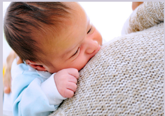
EEN STERKE RELATIE MET HET KIND IS PRIORITEIT TIJDENS HET EERSTE JAAR DAT VROUWEN IN CASA MITSPA VERBLIJVEN