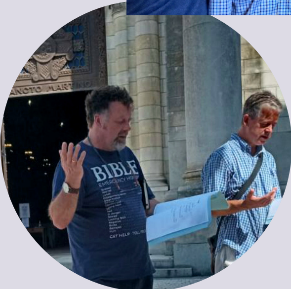
BIDDEN VOOR DE STAD BIJ DE BASILIEK VAN TOURS