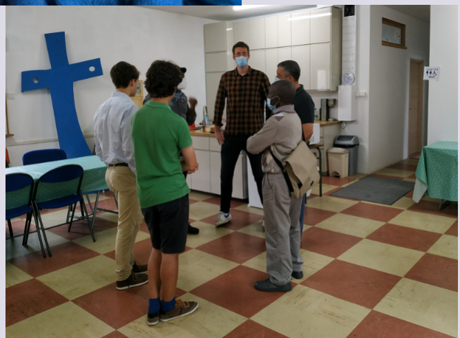
NAPRATEN NA EEN KERKDIENTST