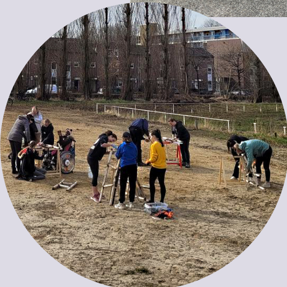
KLUSSEN IN HET BUURTPARK