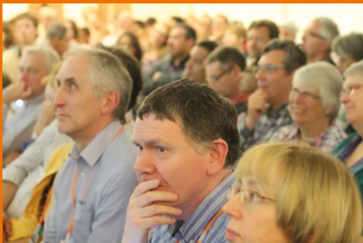
TRAINING EN TOERUSTING IS VAN GROOT BELANG VOOR ZENDINGSWERKERS

Steun dit fonds door een gift aan NL02 INGB 0000 2549 97 tnv Stichting ECM Nederland, onder vermelding van 'ECM Permanent Education Fund'.