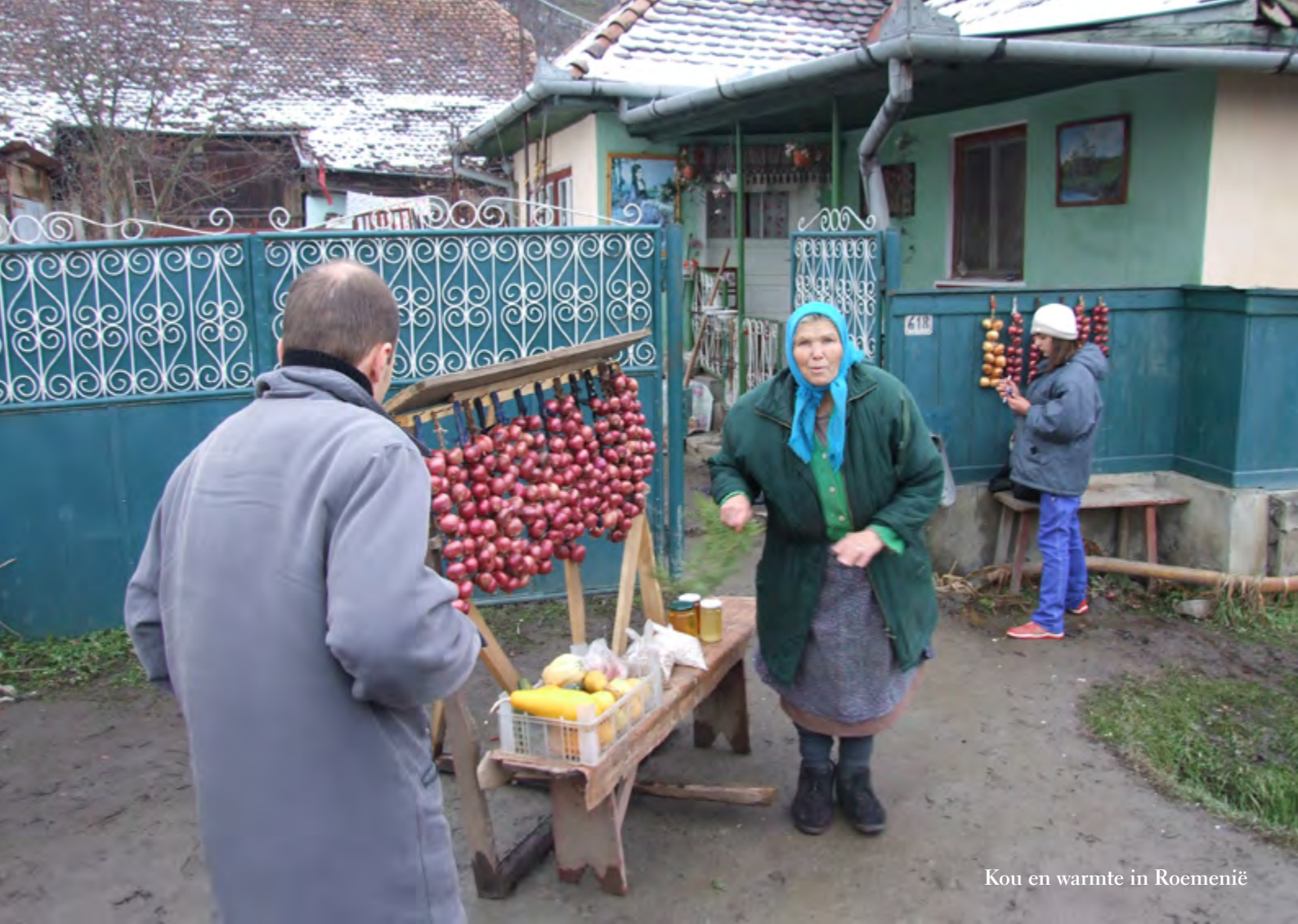
Kou en warmte in Roemenië