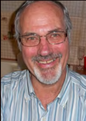
Co Kaptein – Italië, Lamezia Terme