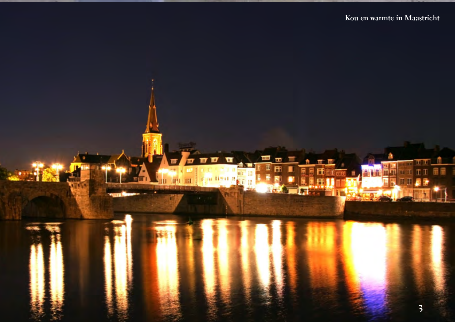
Kou en warmte in Maastricht