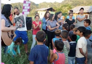
De gemeente doet veel voor kinderen en tieners